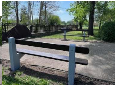
4. VI. Parcella (2026.)