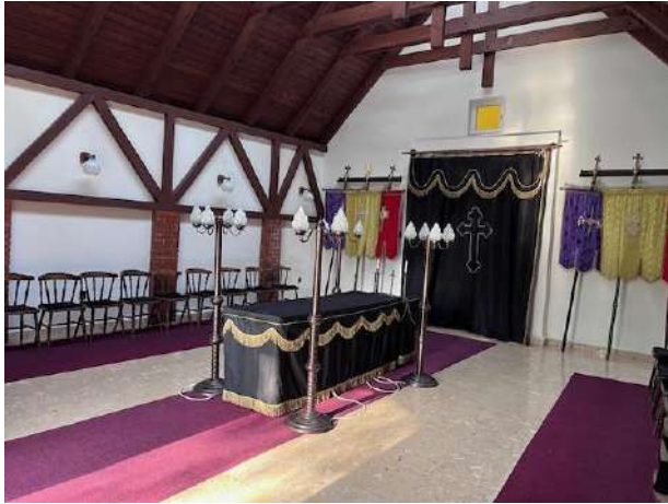
2. Megújult Harangláb